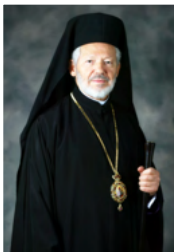
Ο Σεβ. Αρχιεπίσκοπος Καναδά, Υπέρτιμος και Ξεραρχος πάσης Αρκτικής κ. Σωτήριος His Eminence Archbishop Sotirios of Canada, Honourable Exarch of all Arctic