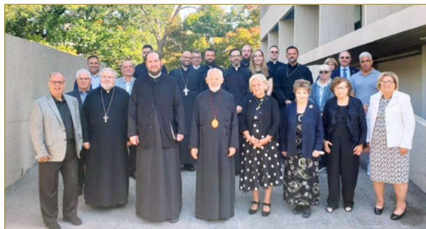
Φθινοπωρινή Συνεδρίαση του Αρχιεπισκοπικού Συμβουλίου Καναδά υπό τη προεδρία του Αρχιεπ. Σωτηρίου. Στη φωτογραφία μέλη του Αρχιεπισκοπικού Συμβουλίου με τον Επισκ. Αθηνάγορα και τον Αρχιεπ. Σωτήριο. Fall meeting of the Archdiocesan Council of Canada under the leadership of Archbishop Sotirios. Pictured are Archbishop Sotirios, Bishop Athenagoras and Council Members.