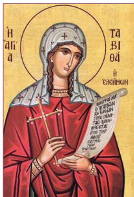
ST. TABITHA October 25

For ye are all the children of God by faith in Christ Jesus.