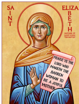
ΑΓ. ΕΛΙΣΑΒΕΤ 24 Απριλίου

Και ἀποκριθεὶς ὁ ἑκατόνταρχος ἔφη· Κύριε, οὐκ εἰμι ἰκανὸς ἵνα μου ὑπὸ τὴν στέγην εἰσέλθης· ἀλλὰ μόνον εἰπέ λόγῳ, καὶ ἰαθήσεται ὁ παῖς μου. Ματθ. 8:8