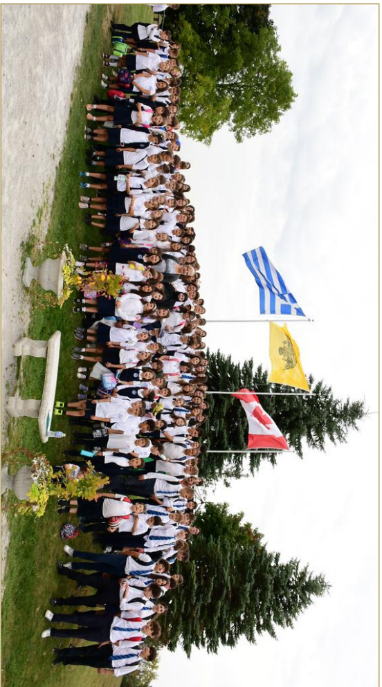
Επίσκεψη των μαθητών του ημερήσιου Ελληνορθόδοξου σχολείου "Μεταμορφωση" της Ι. Αρχιεπισκοπής Καναδά, στην Ι. Μονή Παρποκοσιάς στο Bolton, Ontario. Students from the Archdiocese's Greek Orthodox Day School "Metamorphosis" visiting St. Kosmas Monastery in Bolton, Ontario.