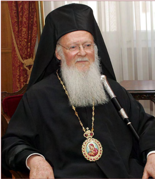
Η Α.Θ.Π. ο Οικουμενικός Πατριάρχης κ.κ. ΒΑΡΘΟΛΟΜΑΙΟΣ His All Holiness Ecumenical Patriarch Bartholomew