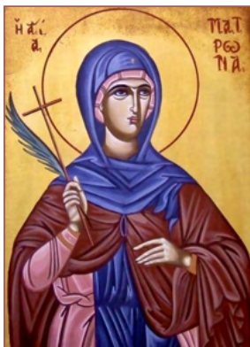
ΑΓ. ΜΑΤΡΩΝΑ 27 Μαρτίου

Ὁ δὲ Ἰησοῦς εἶπεν αὐτῶ· Τὸ εἰ δύνασαι πιστεῦσαι, πάντα δυνατὰ τῶ πιστεύοντι καὶ εὐθέως κράξας ὁ πατὴρ τοῦ παιδίου μετὰ δακρῶν ἔλεγε· Πιστεύω, Κύριε· βοήθει μου τῇ ἀπιστίᾳ. Μάρκ. 9:23-24