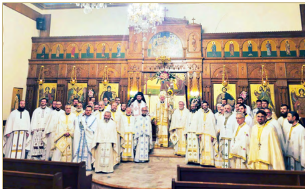
Ετήσια Πνευματική Σύναξη των Ιερέων Καναδά στο Kingston, Ontario. Η φωτογραφία από την βραδινή Θ. Λειτουργία στον Ι.Ν. Κοίμησης της Θεοτόκου, Kingston με τον Αρχιεπ. Σωτήριο, τον Επισκ. Αθηνάγορα και τους Ιερείς. Annual Clergy Retreat in Kingston, Ontario. Pictured are Archbishop Sotirios, Bishop Athenagoras and all the priests during the Evening Divine Liturgy at Koimisis Tis Theotokou Church.