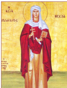
ΑΓ. ΘΕΚΛΑ 24 Σεπτεμβρίου

Καὶ ἐπλήσθησαν ἅπαντες Πνεύματος ἁγίου, καὶ ἤρξαντο λαλεῖν ἐτέραις γλώσσαις καθὼς τὸ Πνεῦμα ἐδίδου αὐτοῖς ἀποφθέγγεσθαι Πράξ. 2:4