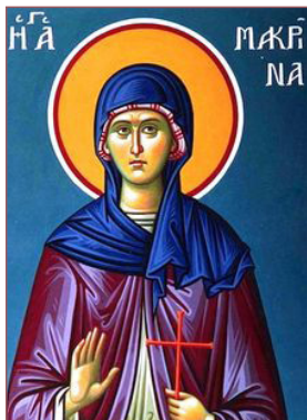
ΑΓ. ΜΑΚΡΙΝΑ 19 Ιουλίου

Πέτρος δὲ ἔφη πρὸς αὐτούς· Μετανοήσατε, καὶ βαπτισθήτω ἕκαστος ὑμῶν ἐπὶ τῷ ὀνόματι Ἰησοῦ Χριστοῦ εἰς ἄφεσιν ἁμαρτιῶν, καὶ λήψεσθε τὴν δωρεὰν τοῦ ἁγίου Πνεύματος. Πράξ. 2:38