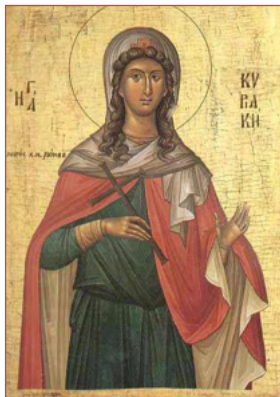
ST. KYRIAKI July 7

Then Peter said unto them, Repent, and be baptized every one of you in the name of Jesus Christ for the remission of sins, and ye shall receive the gift of the Holy Spirit. Acts 2:38