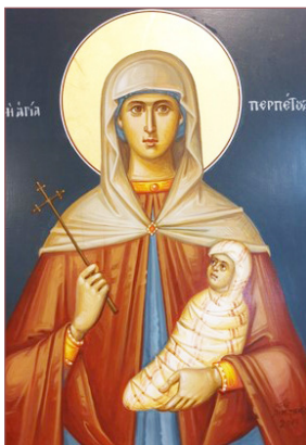
ΑΓ. ΠΕΡΠΕΤΟΥΑ 1 Φεβρουαρίου

Ἐλεγεν γὰρ ἐν ἑαυτῇ ὅτι ἐὰν ἄψωμαι κἂν τῶν ἱματίων αὐτοῦ, σωθήσομαι καὶ εὐθέως ἐξηράνθη ἡ πηγὴ τοῦ αἵματος αὐτῆς, καὶ ἔγνω τῶ σώματι ὅτι ἴται ἀπὸ τῆς μάστιγος. Μάρκ. 5:28-29