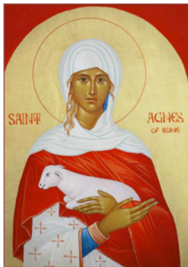
ST. AGNES January 21

And Jesus answered and said unto him, "What wilt thou that I should do unto thee?" The blind man said unto Him, "Lord, that I might receive my sight."