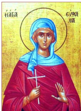
ST. EUTHALIA March 2

Jesus said unto him, “If thou can’t believe, all things are possible to him that believeth.”