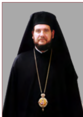
His Grace Bishop Athenagoras of Patara, Dean of Patriarchal Toronto Orthodox Theological Academy

Η ίδρυση και λειτουργία της Πατριαρχικής Ορθόδοξης Θεολογικής Ακαδημίας Τορόντο αποτελούσε όραμα του τότε Μητροπολίτη και τώρα Αρχιεπισκόπου Καναδά Σωτηρίου, για τον καταρτισμό νέων κληρικών. Με εισήγησή του η κληρικολαϊκή συνέλευση, το 1997, εψήφισε ομόφωνα την ίδρυσή της. Άρχισε τη λειτουργία της τον Σεπτέμβριο του 1998 με 7 φοιτητές.