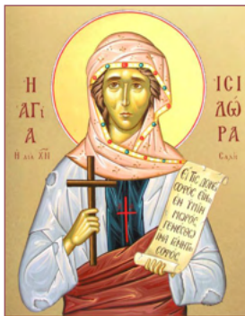
ΑΓ. ΙΣΙΔΩΡΑ 1 Μαΐου

Καὶ ἰδοὺ προσέφερον αὐτῷ παραλυτικὸν ἐπὶ κλίνης βεβλημένον. καὶ ιδὼν ὁ Ἰησοῦς τὴν πίστιν αὐτῶν εἶπεν τῷ παραλυτικῷ· Θάρσει, τέκνον· ἀφέωνταί σοι αἱ ἁμαρτίαι σου Ματθ. 9:2