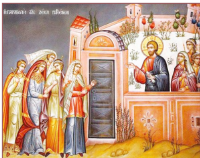
10 VIRGINS April 30

The centurion answered and said, "Lord, I am not worthy that Thou shouldst come under my roof. But speak the word only, and my servant shall be healed.