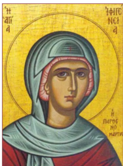
ST. EPHIGENIA November 16

It is easier for a camel to go through the eye of a needle, than for a rich man to enter into the kingdom of God. Mark 10:25