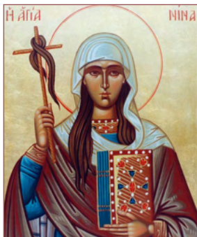
ΑΓ. ΝΙΝΑ 14 Ιανουαρίου

Καὶ ἀποκριθεὶς λέγει αὐτῷ ὁ Ἰησοῦς· Τί σοι θέλεις ποιήσω; ὁ δὲ τυφλὸς εἶπεν αὐτῷ· Ραββουνί, ἵνα ἀναβλέψω καὶ ὁ Ἰησοῦς εἶπεν αὐτῷ· Ὑπαγε, ἡ πίστις σου σέσωκέ σε καὶ εὐθέως ἀνέβλεψε, καὶ ἠκολούθει τῷ Ἰησοῦ ἐν τῇ ὁδῷ. Μάρκ. 10:51-52