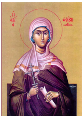
ST. PHOEBE September 3

And they were all filled with the Holy Ghost, and began to speak with other tongues, as the Spirit gave them utterance.