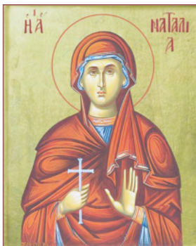
ΑΓ. ΝΑΤΑΛΙΑ 26 Αυγούστου

Νῦν ἀπολύεις τὸν δοῦλόν σου, δέσποτα, κατὰ τὸ ῥῆμά σου ἐν εἰρήνῃ, ὅτι εἶδον οἱ ὀφθαλμοί μου τὸ σωτήριόν σου Λουκ. 2:29-30