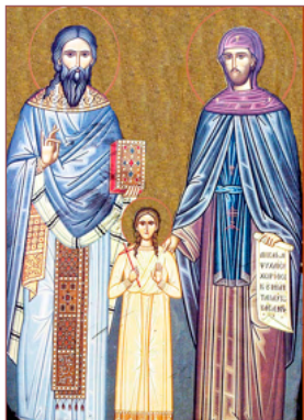
STS RAPHAEL, NICHOLAS, IRENE May 7